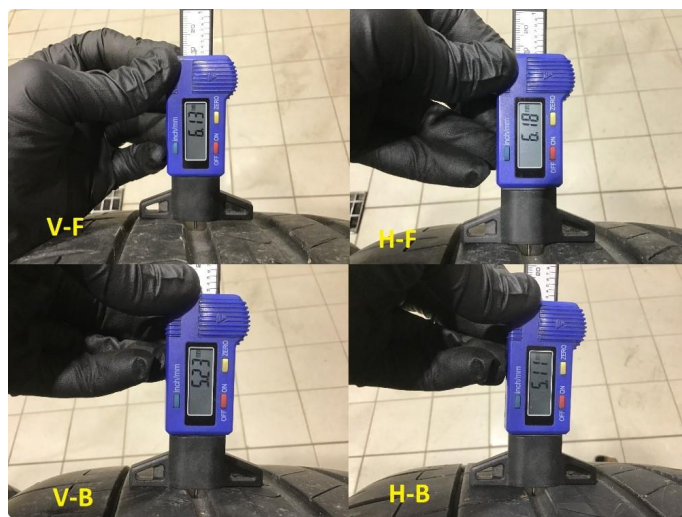
1.3 Mønsterdybde sommerdekk målt ved takst 08.11.2023, 14.313km.