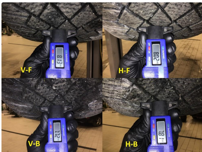
1.4 Mønsterdybde vinterdekk målt ved takst 08.11.2023, 14.313km.