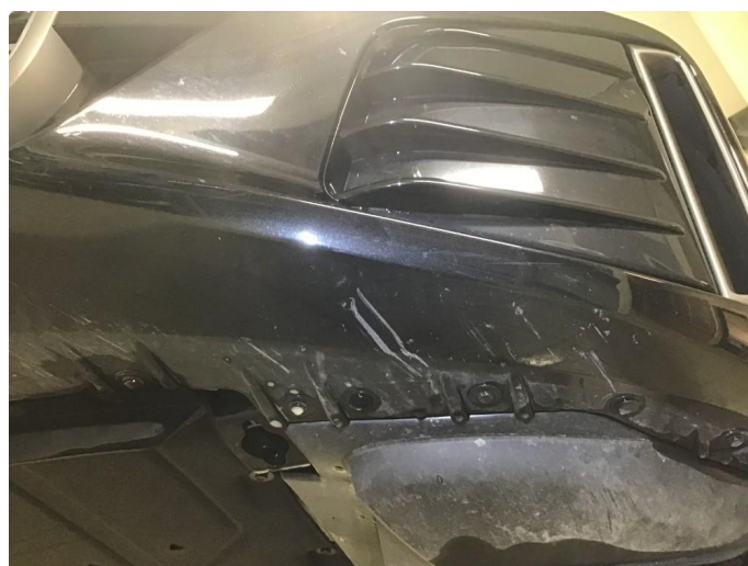
1.5 Noen brukmerker underkant fremfanger, regnes som normal bruksslitasje.