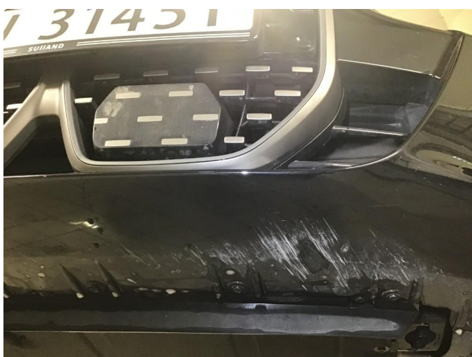
1.5 Noen brukmerker underkant fremfanger, regnes som normal bruksslitasje.