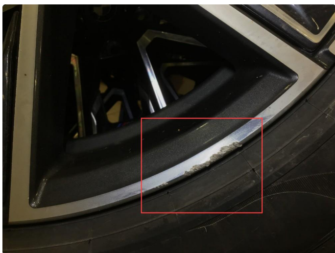
1.2 Lite brukmerke på 1 sommerfelg, regnes som normal bruksslitasje.