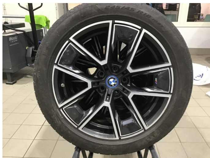
1.2 Lite bruksmerke på 1 sommerfelg, regnes som normal bruksslitasje.